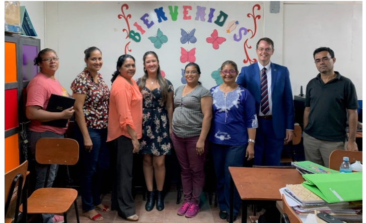
Director MINEDU, profesores & equipo de ApplianSys

Okmindmap.com – app de mapa semántico basado en la nube